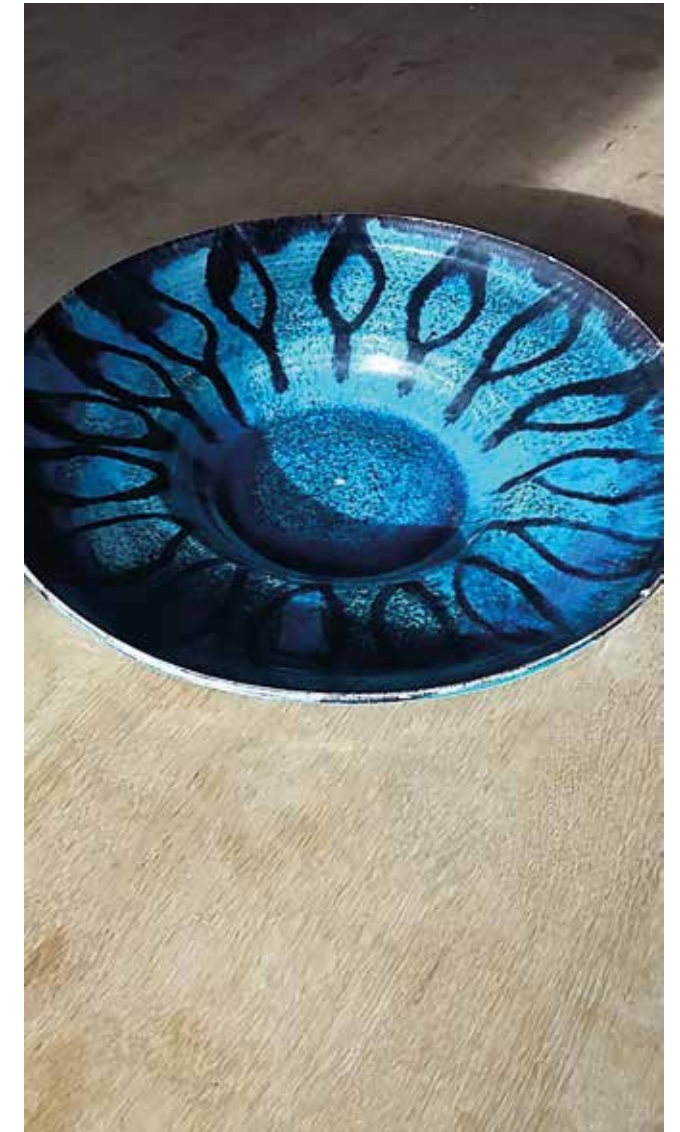
Schale, 23 x 6 cm, Ton, 1964

Manchmal sitze ich noch an meiner 50jährigen Fußdreh-scheibe, aber große Stücke wollen nicht mehr so gelingen.