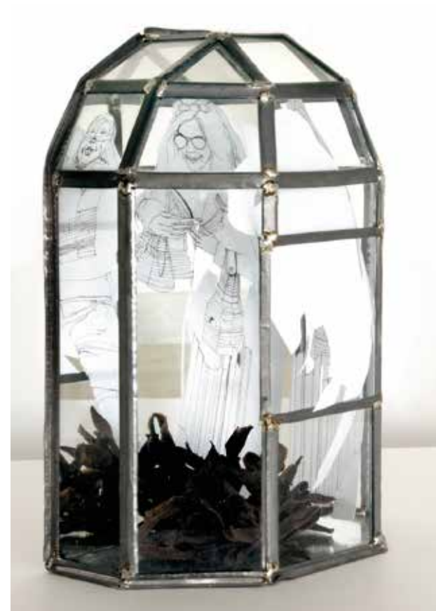
„Gehäuse“, Objekt, ca. 30 x 20 x 15 cm, 2009

Sicht der Kunst und der Welt kultiviert wird. Die Beweglichkeit zwischen den Sichtweisen und Medien ist das, was mich in der Kunst interessiert, die Durchlässigkeit von Wahrnehmungen. Mein Weg führte von der Sprache und der Zeichnung in die Arbeit im und mit dem Raum, über Raumzeichnungen, Objekte und skulpturale Aspekte. Am wichtigsten war für mich die Erkenntnis, dass Zeichnung und Bildhauerei in meiner Arbeit nicht unterschieden sind, sondern dass sie auf unterschiedliche Weise Aspekte des Möglichen und des Tatsächlichen beschreiben. Insofern war in meiner Zeit an der Akademie die Bewegung, die Veränderung und die Filterung wichtig, sowie der Weg in den Raum und die Auseinandersetzung mit installativen Konzepten.