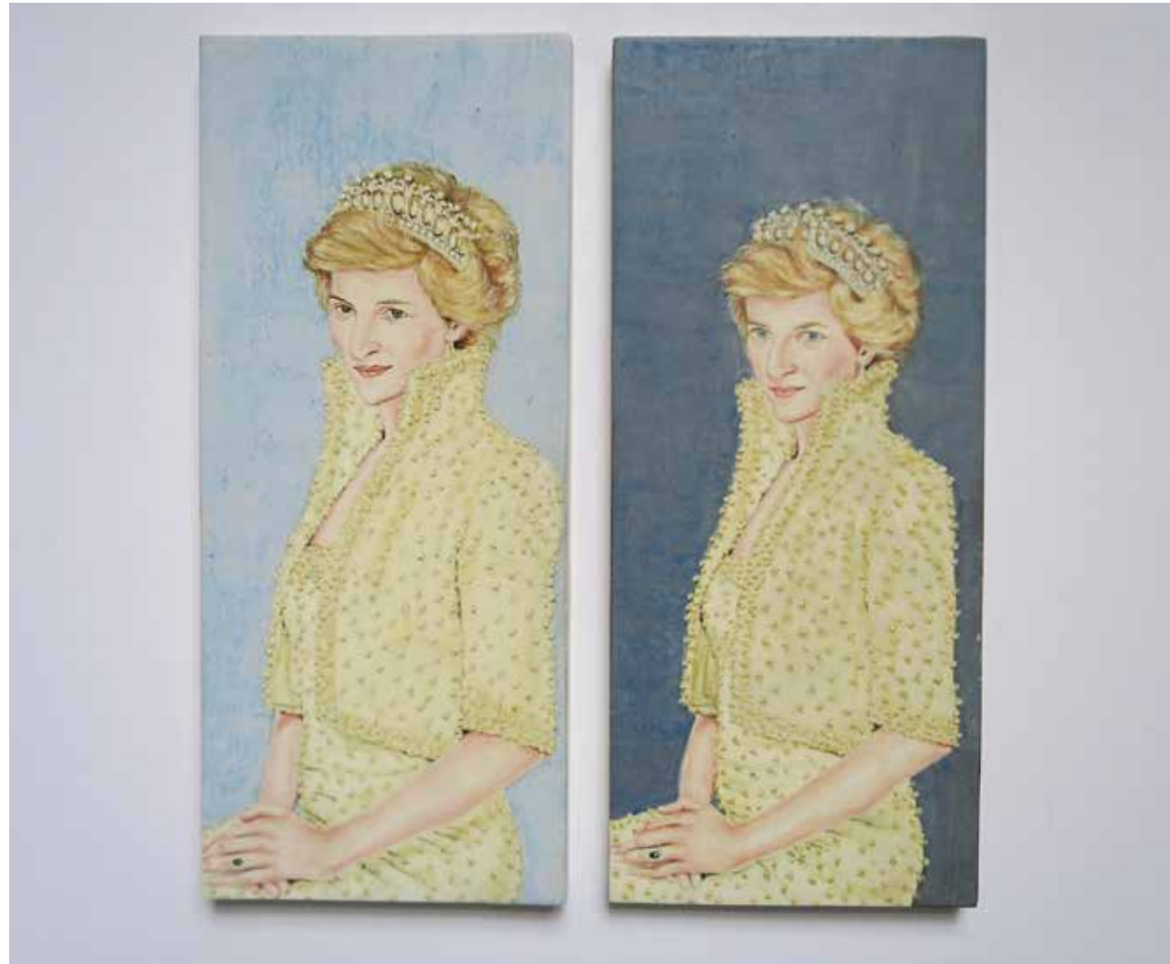
Lady Di, Öl- und Leimfarbe auf Kreidegrund auf Holz, je 9 x 27 cm, 1999