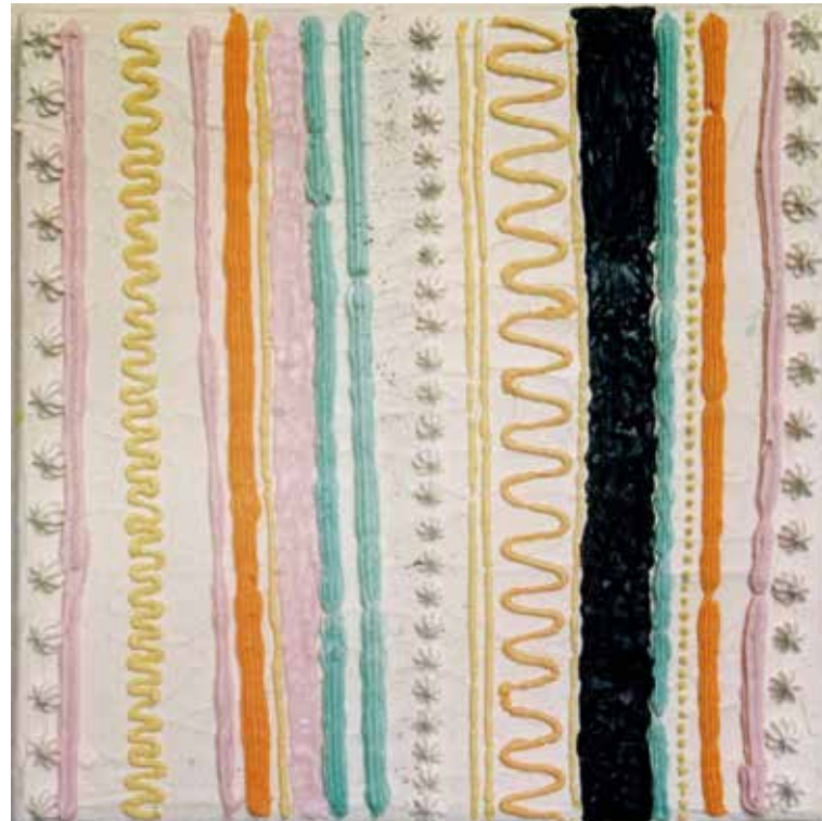
„Torte“ Ölfarbe auf Nessel 30 x 30 cm 1997