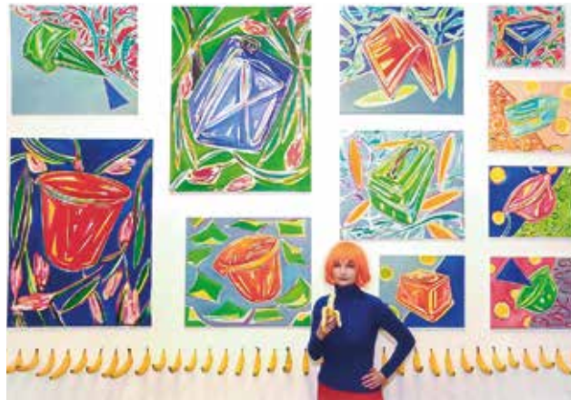
Confrontation one Bildfeld mit Bananenornamentband, 528 x 350 cm, 1998

Ich habe Kontakt zu Künstler*innen aus dem Studium, wie zum Beispiel zu Römer + Römer, mit denen ich 2004 PARADIES IM BUNKER im Kunstbunker Tumulka organisiert habe, obwohl viele nach Berlin gegangen sind und ich nach München. Manche haben ganz mit der Kunst aufgehört, für einige läuft es aber auch richtig gut. Die Akademie war eine tolle Zeit, mit Reisen nach Amerika und quer durch Europa. Insgesamt eine wichtige und Impuls gebende Zeit, die ich nicht missen möchte.