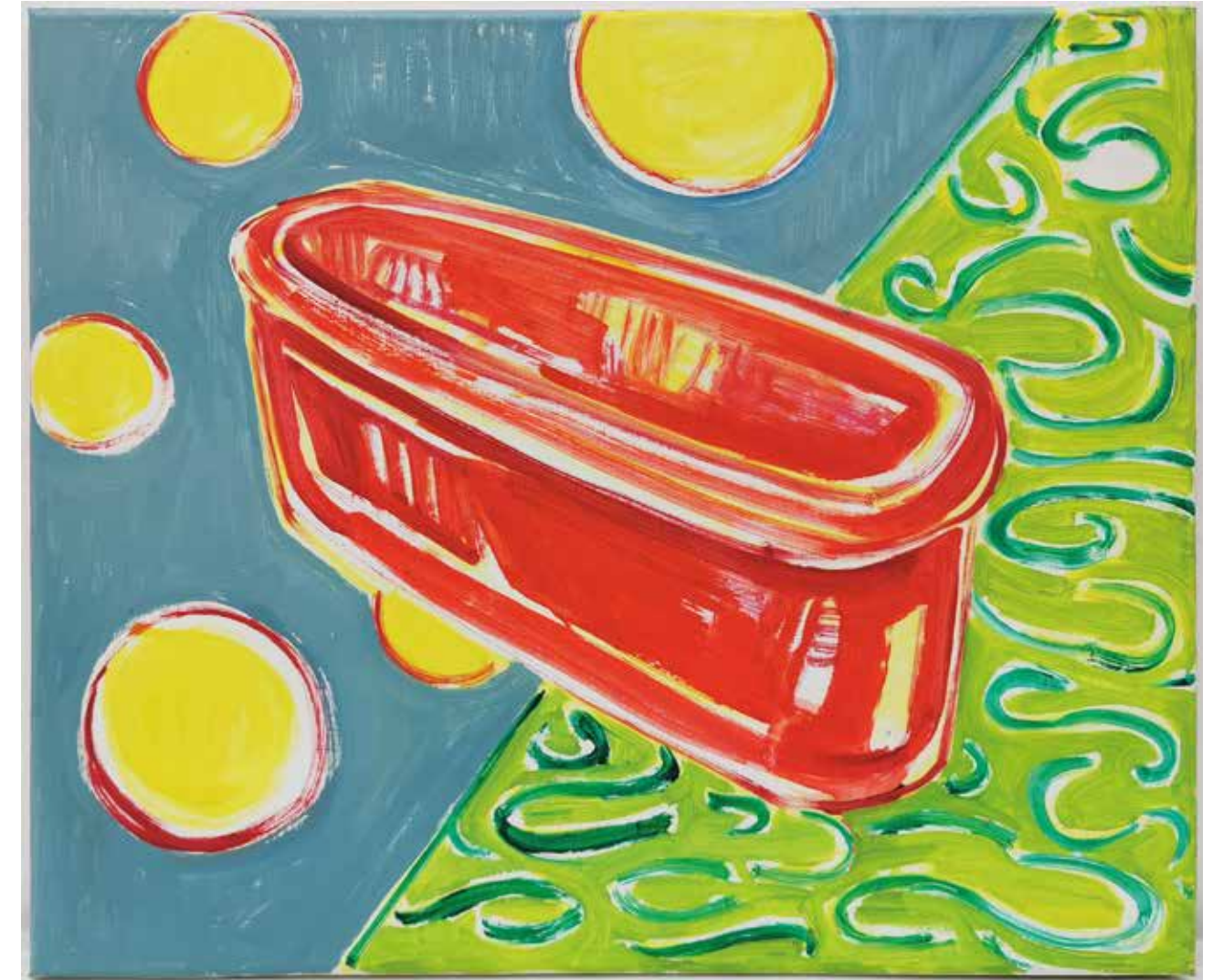
Moon landing, 40 x 50 cm, Öl auf Leinwand, 1997

Jahr an der Akademie Düsseldorf von diesen Formalien befreien können, indem ich die Farbe für mich entdeckt habe. In diesem Zusammenhang ist auch die in der Ausstellung gezeigte Arbeit entstanden. Ich habe mich zunehmend mit den schrillen Farben von Plastikgegenständen identifiziert, die mich durch ihre häufige Dominanz in der Küche, einem ehemals und immer noch weiblichen Betätigungsfeld, begeistert haben. Ich war damals fasziniert, Bilder im Stil der Petersburger Hängung, bunte Bildfelder, entstehen zu lassen, die durch ein Bananenornamentband in den Raum gewachsen sind. Durch das Malen von Gegenständen, meine Kinder, aber auch aus meiner eigenen Kindheit, habe ich eine große Plastiksammlung, aus der ich Installationen im Küchenkontext gebaut habe, die sich zunehmend aus diesem Zusammenhang gelöst haben. 2016 kamen dann die Absperrbänder aus Plastik dazu, mit denen ich jetzt raumfüllend arbeite. Meinen Akademiebrief habe ich bei Rosemarie Trockel gemacht, so dass 2000 mit der Gründung von KITCHNAPPING Videoarbeiten dazugekommen sind, mit denen ich selbstreflexiv und themenbezogen arbeite.