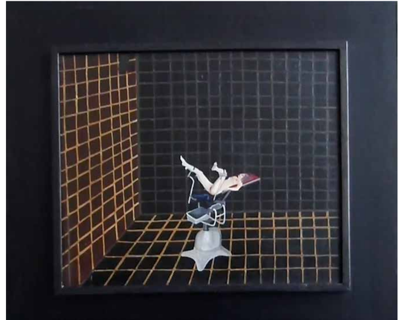
O.T., Ölbild, 1973, 47 x 42 cm Rahmengröße

Ich begann, mich bildhaft mit dem Nationalsozialismus zu beschäftigen, später interessierten mich andere Kulturen und ihre Unterdrückungsmechanismen, die sich in allen Kulturen sehr deutlich in der Behandlung und dem Stellenwert von Frauen zeigen.