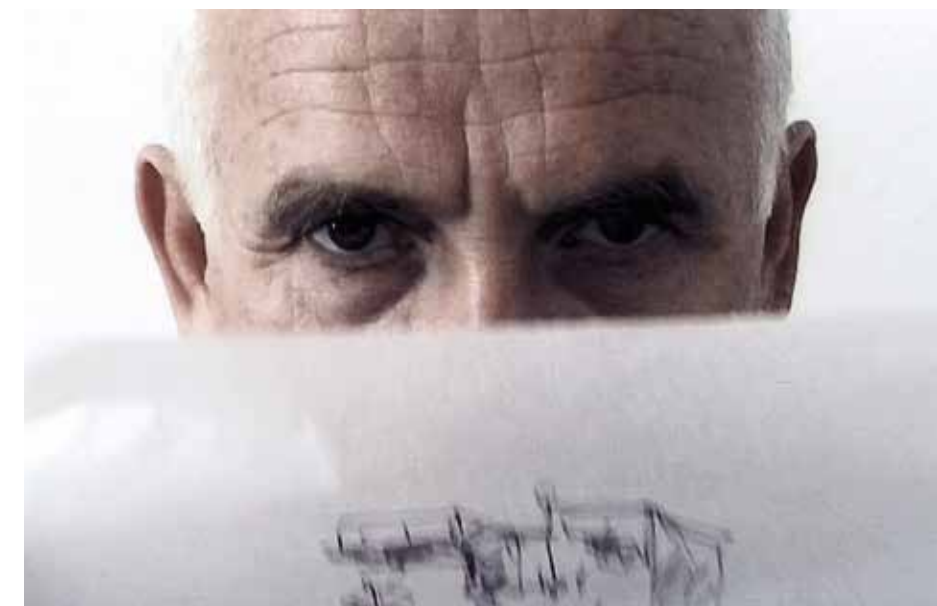
MUSEN küssen _ IDEEN knistern _ ARCHITEKTEN knautschen, 07:37 Videoloop, 2002