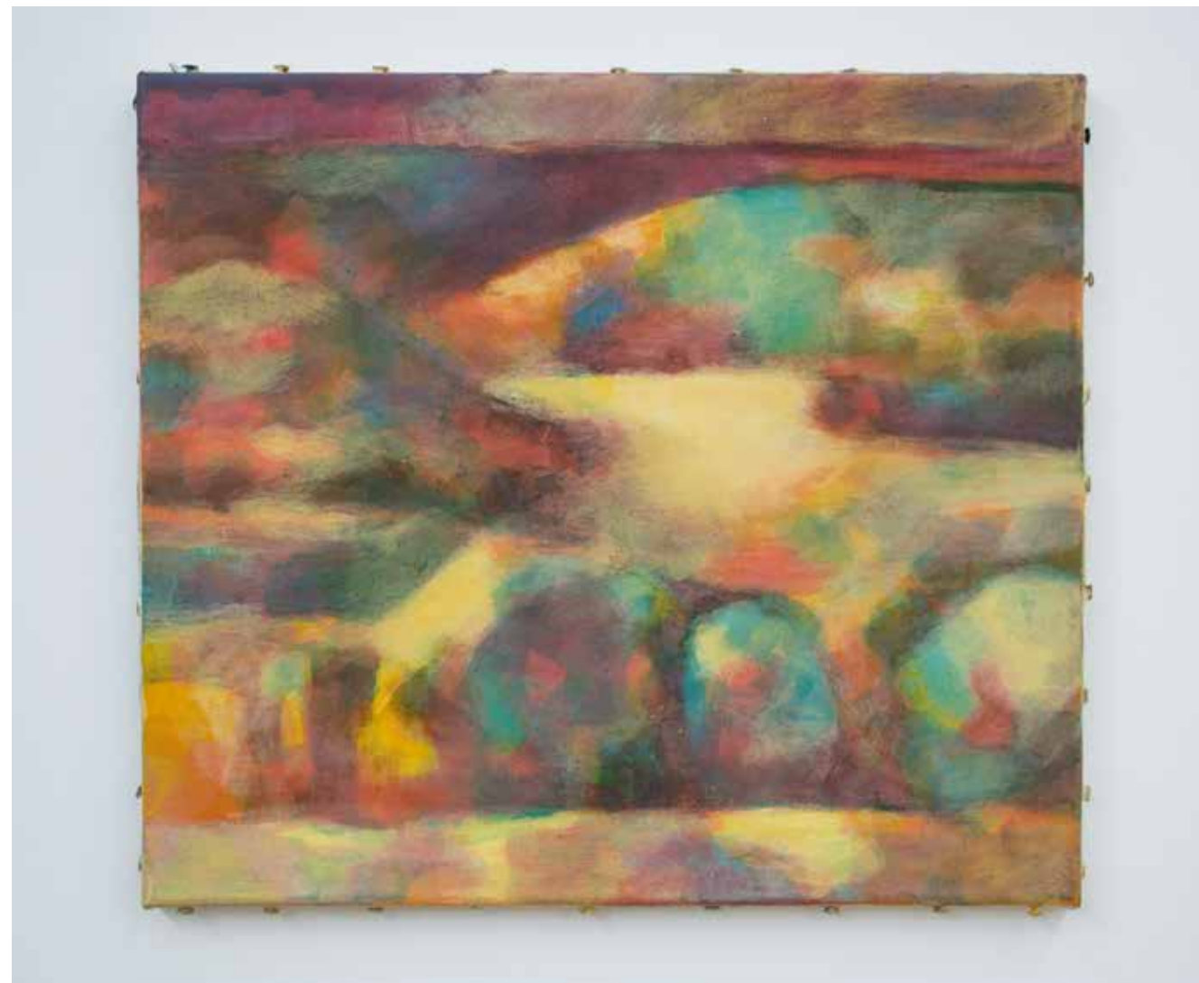
Landschaft bei La Villa, Italien, Eitempera auf Halbkreidegrund auf Leinwand, 39,5 x 45 cm, 1984

Die ausgewählte Arbeit ist in Italien in der Toskana entstanden. Dort haben G. und ich oft viele Wochen am Stück in der Landschaft gearbeitet. Stimmungen von besonderer Intensität haben mich beim Malen erfüllt, das phantastische Licht, die Weite und Stille dieser alten Landschaft.