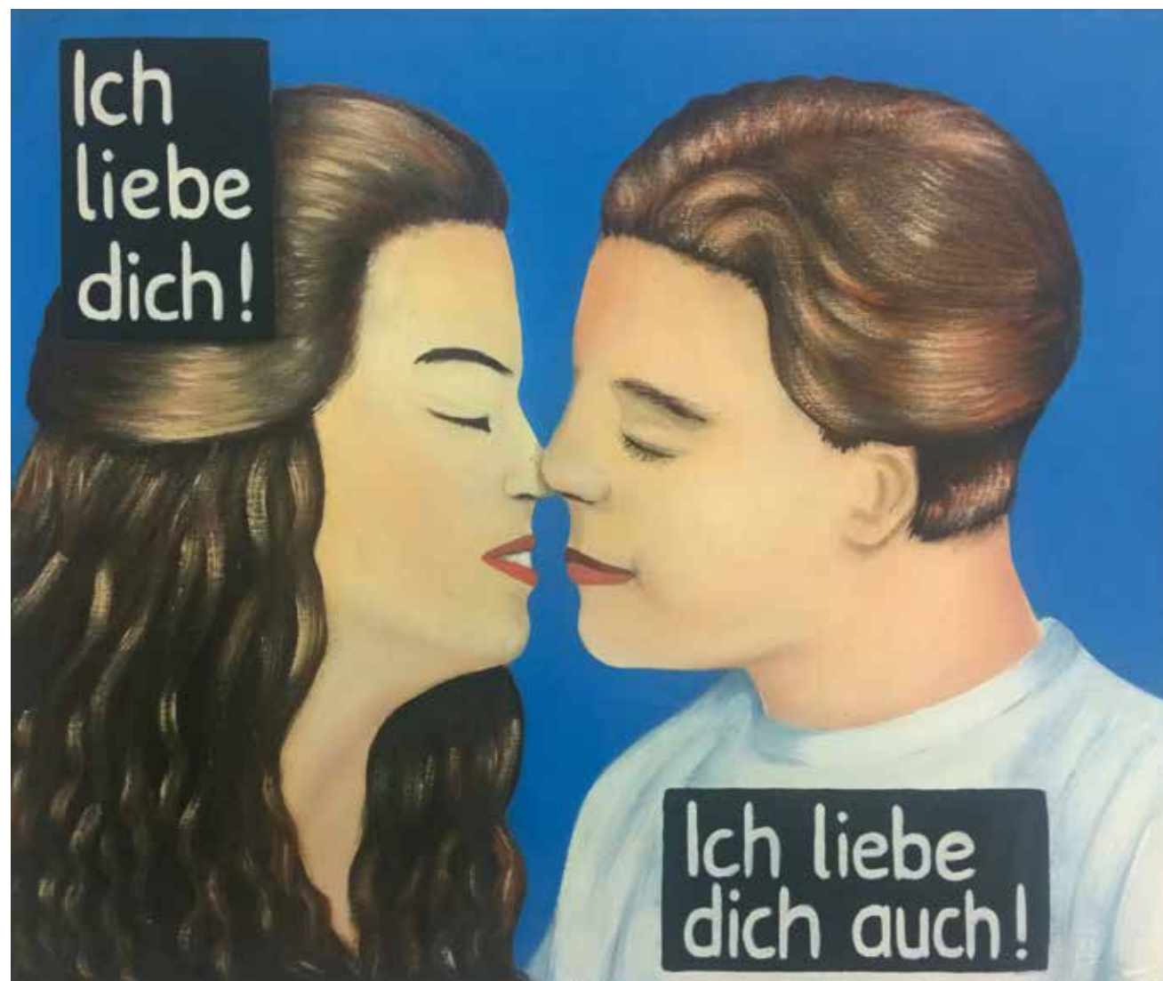
„Ich liebe dich“, 50 x 60 cm, Acryl auf Leinwand, ca. 1993